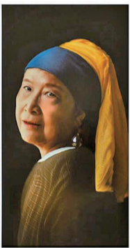
アプリを使って、絵画の主人公にコソプレ