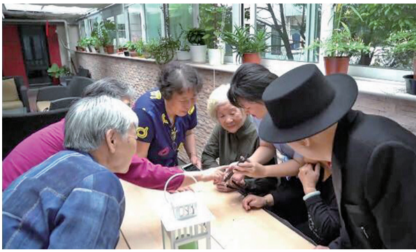
コソプレの打合せ